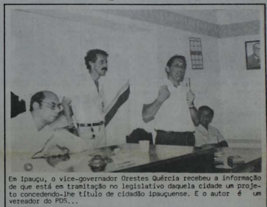
Em Ipaçu, o vice-governador Orestes Quércia recebeu a informação de que está em tramitação no legislativo daquela cidade um projeto concedendo-lhe título de cidadão ipauçuense. E o autor é um vereador do PDS...