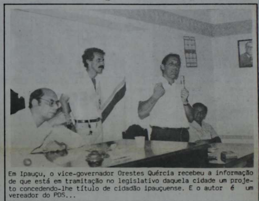
Em Ipaçu, o vice-governador Orestes Quercia recebeu a informação de que está em tramitação no legislativo daquela cidade um projeto concedendo-lhe título de cidadão ipauçuense. E o autor é um vereador do PDS...